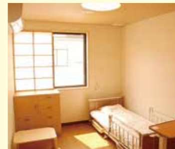
居室スペース (1人) 洋