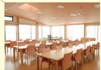
食堂・機能訓練室